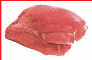
Putenoberkeulfleisch ohne Haut, ohne Knochen, tiefgefroren

Artikel-Nr. 9115 Gewicht ca. 10 kg Inhalt ca. 10 kg Lagenfaktor 5 Palettenfaktor 50 EAN-Code der Verbrauchereinheiten 40 04860 09115 0