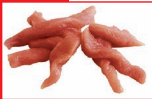
Putenbrust-geschnetzeltes bulk, tiefgefroren

Artikel-Nr. 9160 Gewicht 4 x 2,5 kg Inhalt 10 kg Lagenfaktor 5 Palettenfaktor 50 EAN-Code der Verbrauchereinheiten 40 04860 09160 0