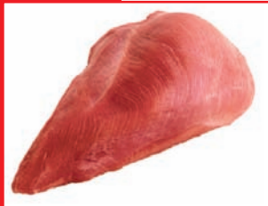
Putenbrust ohne Haut, ohne Knochen, vom Hahn, tiefgefroren

Artikel-Nr. 9161 Gewicht 4 x 2,5 kg Inhalt 10 kg Lagenfaktor 5 Palettenfaktor 50 EAN-Code der Verbrauchereinheiten 40 04860 09161 7