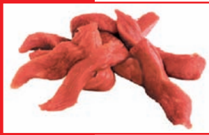
Putenoberkeulengeschnetzeltes bulk, tiefgefroren

Artikel-Nr. 9150 Gewicht 4 x 2,5 kg Inhalt 10 kg Lagenfaktor 5 Palettenfaktor 50 EAN-Code der Verbrauchereinheiten 40 04860 09150 1