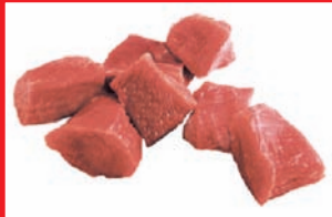
Putenoberkeulengulasch bulk, tiefgefroren

Artikel-Nr. 9160 Gewicht 4 x 2,5 kg Inhalt 10 kg Lagenfaktor 5 Palettenfaktor 50 EAN-Code der Verbrauchereinheiten 40 04860 09160 0